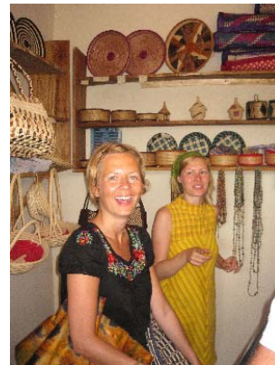
KERWDA's craft shop