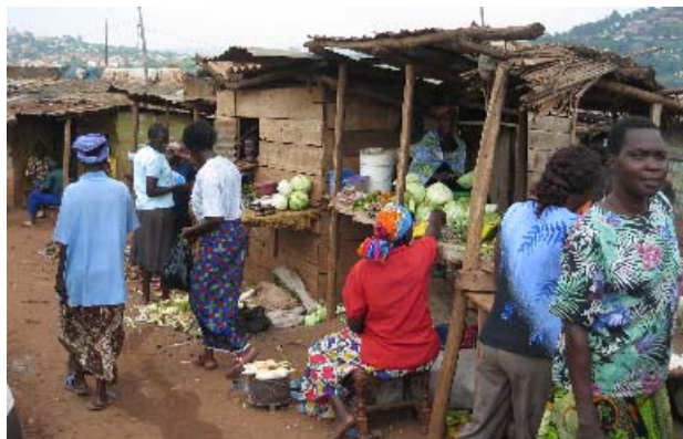
Banda – flyktningleiren utenfor Kampala