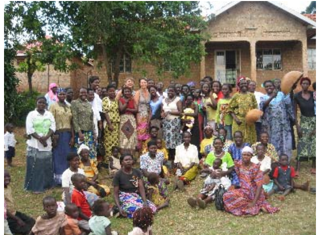
Acholikvinnene på eiendommen til grisehuset

Vi er kun heiagjengen på sidelinjen – som kan kjøpe kvoten når vi lander på Gardermoen og tenke at kvoten tilsvarer en gris som kan gi livsopphold til en familie i Uganda.